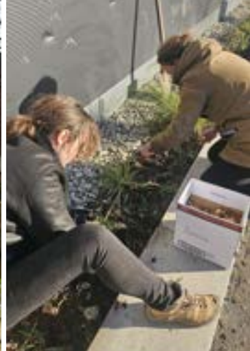
Bloembollen planten in Utrecht