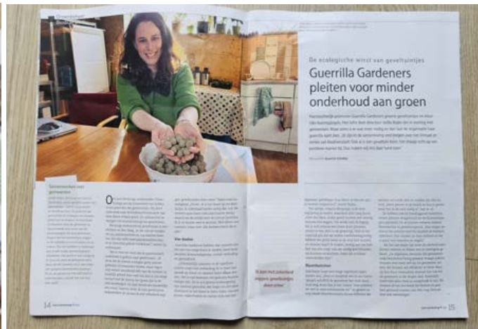
In Tuin & Landschap