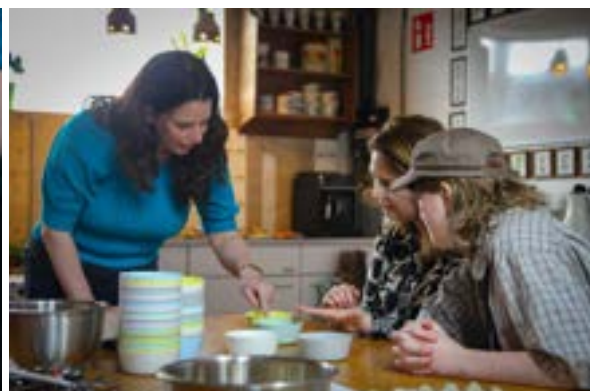
Tijdens de bloembommen workshop