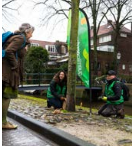
Bloembollen planten in Amersfoort