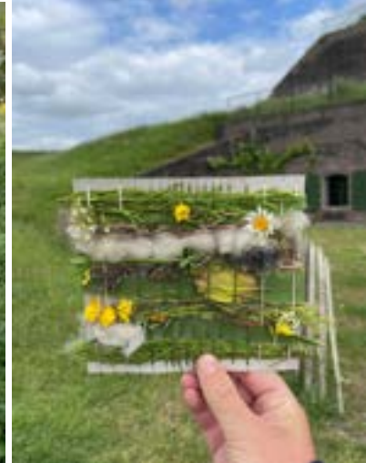
Groene Doeners en Makers Weekend