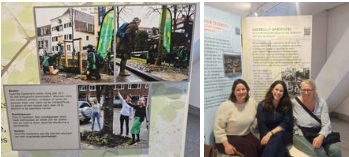
Bij tentoonstelling de Utrechtse stoep

Met onze bijdrage wilden we laten zien dat vergroening niet alleen gaat over planten, maar vooral ook over mensen. Een vergroende stoep nodigt uit tot ontmoeting, gesprek en samenwerking. Juist die combinatie van natuur, creativiteit en gemeenschapsvorming vormt de kern van de aanpak van Stichting Guerrilla Gardeners.