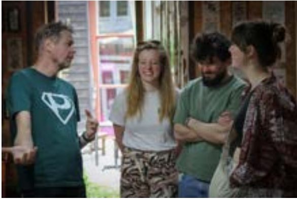
Plandelman met buurtbewoners