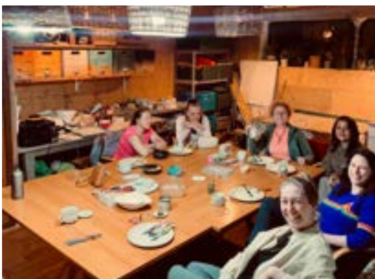
Groene doeners en makers meetup

De Groene Doeners en Makers Meetup onderstreepte het belang van ontmoeting en kennisuitwisseling binnen de groene beweging. Veel maatschappelijke en ecologische uitdagingen vragen om samenwerking, creativiteit en een sterk netwerk. Door ruimte te creëren voor deze ontmoetingen draagt Stichting Guerrilla Gardeners bij aan het versterken van een groeiende gemeenschap van mensen die zich inzetten voor een groenere, socialere en veerkrachtige samenleving.