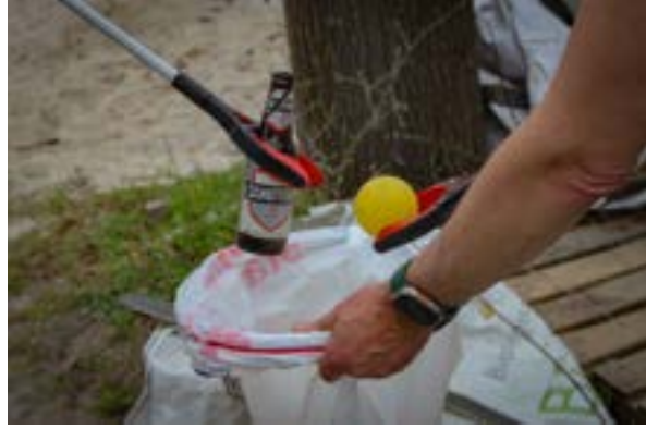
Plandelen in het Werkspoorkwartier