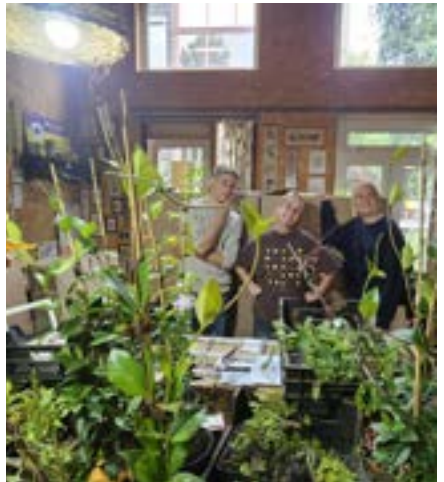
Guerrilla Gardeners kreeg hulp van Fair Future Generators