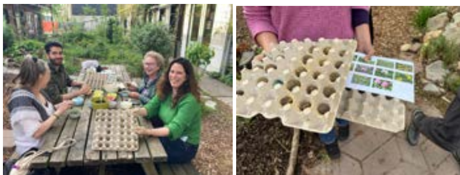
Bloembommen maken voor Nationale Zaaidag

De bijeenkomst leidde tot inspirerende gesprekken over de kansen en uitdagingen van het vergroenen van buurten. Deelnemers deelden ervaringen over het activeren van bewoners, het opbouwen van lokale netwerken en het creëren van langdurige betrokkenheid bij buurtgroen. De bijeenkomst onderstreepte opnieuw dat vergroening niet alleen gaat over planten en biodiversiteit, maar ook over het versterken van sociale verbindingen en het vergroten van het gevoel van eigenaarschap in de buurt.